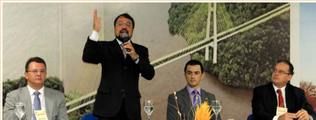
Ao lado do governador do Estado do Amapá, Camilo Capiberibe, o Procurador Armando Melo foi peça principal da Reunião de Socialização do Projeto de Reestruturação Organizacional da Procuradoria Amapaense.

Também foi iniciado um trabalho junto ao Colégio Nacional de Procuradores Gerais, por ocasião do Congresso Nacional de Procuradores, para a instalação de um Fórum Nacional de Planejamento Estratégico.